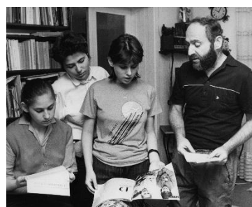
László Polgár mit seinen drei Töchtern (1989)

In der Schachwelt opfern wir manchmal. Wir trennen uns von einer Figur, um schneller voranzukommen. Judit hat in ihrem Leben eine Menge geopfert – Türme, Damen, Tausende von Bauern. Ihre Kindheit für die Karriere, ihre Karriere für ihre Kinder und für ein normales Familienleben. Judit: «Schön ist das Unerwartete. Das, was nicht den Mustern entspricht und trotzdem funktioniert. » In diesem Sinne: sie führt ein schönes Leben.