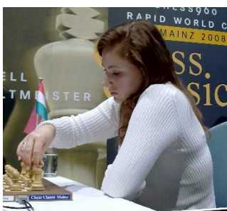
Judit Polgár, Mainz 2008

Im Jahr 2000 heiratet sie ihren Freund, einen Veterinär und bekommt zwei Kinder, 2005 und 2007. Kein Schach, kein Privatunterricht, Experiment abgeschlossen. 2014 zieht sie sich aus dem Turnierschach zurück, wirbt aber noch für Schach, kommentiert Partien und trainiert die ungarische Nationalmannschaft.